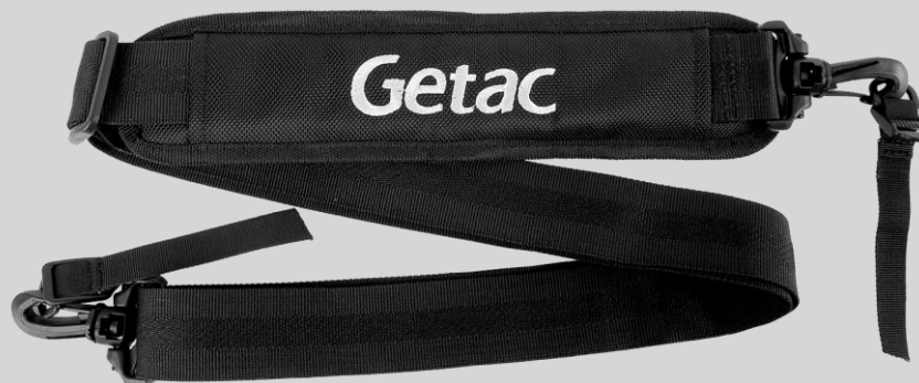
Photo du produit