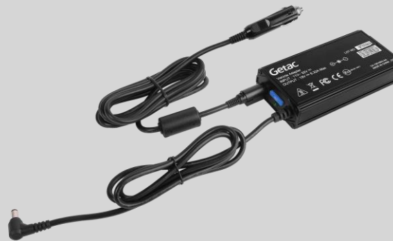
Version prise allume-cigare