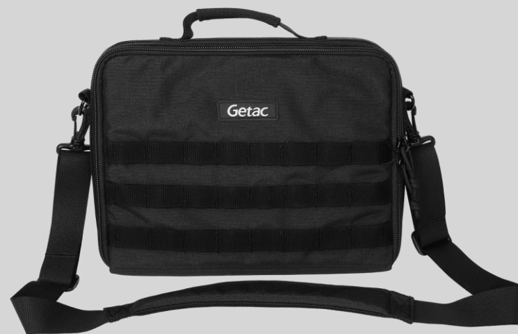
Photo du produit