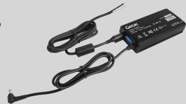
Version fils dénudés