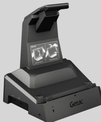
Photo du produit

* UE = E, US = U, UK = K, AU = A, CHN = C, TW = T - Cordons d'alimentation